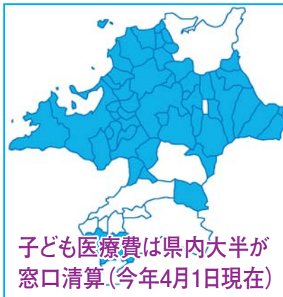
子ども医療費は県内大半が窓口清算(今年4月1日現在)

北九州市は遅れている 子ども医療費 北九州市の乳幼児等医療費支給制度は償還方式で、所得制限があります。県内の大半は窓口清算（たてかえ不要）（地図）で所得制限なしです。 議会では①通院費支給の中学3年（当面小学6年）までの拡大、②窓口清算方式への変更、③所得制限の廃止を強く求めました。